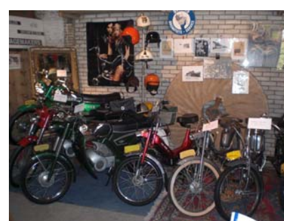
Nico en een gedeelte van zijn collectie